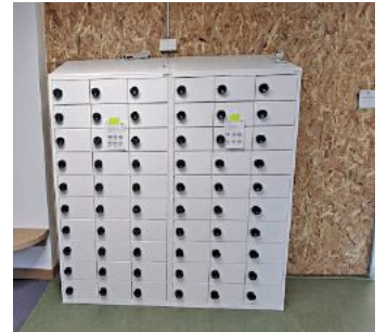
Die Schließfächer mit der noch künstlerisch zu gestaltenden Interims-wand

nach wie vor in der Mensa der Mittelschule angeboten.