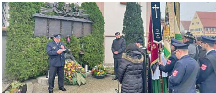
Gedenken der Toten am Kriegerdenkmal in Balzhausen 2024

Balzhausen. Im Anschluss an den Gottesdienst um 8.45 Uhr hält der Krieger- und Soldatenverein Balzhausen, anlässlich des Volkstrauertags am 16. November, wieder eine Totenehrung ab. Mit dem Gedenken an die Toten der beiden Weltkriege im letzten Jahrhundert,