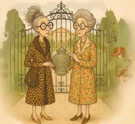
Eine Krimikomödie von Martina Göhring