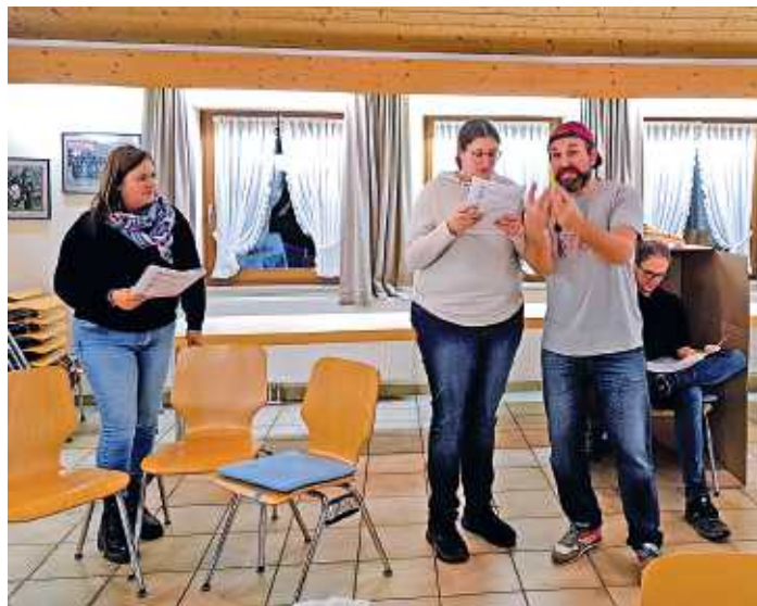
Die Theaterfreunde Münsterhausen proben schon fleißig für die Aufführungen im Januar 2026.

Theaterfreunde Münsterhausen starten im neuen Jahr mit Krimikomödie in die Theatertage