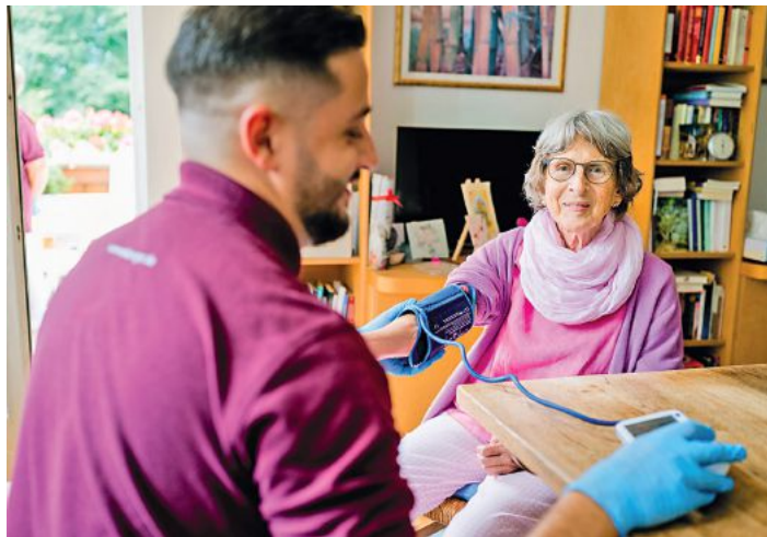
Selbstbestimmt im eigenen Zuhause leben: Der Ambulante Dienst Burtenbach der Rummelsberger Diakonie ermöglicht genau das.

Ambulanter Dienst Burtenbach der Rummelsberger Diakonie lädt zum Tag der offenen Tür ein