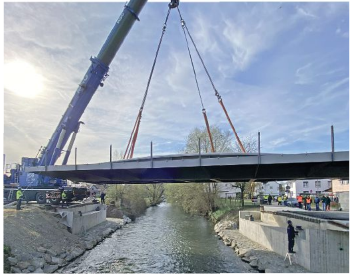
Die neue Mindelbrücke an der Wettenhauser Straße in Jettingen-Schep-pach wurde am Donnerstag eingehoben.