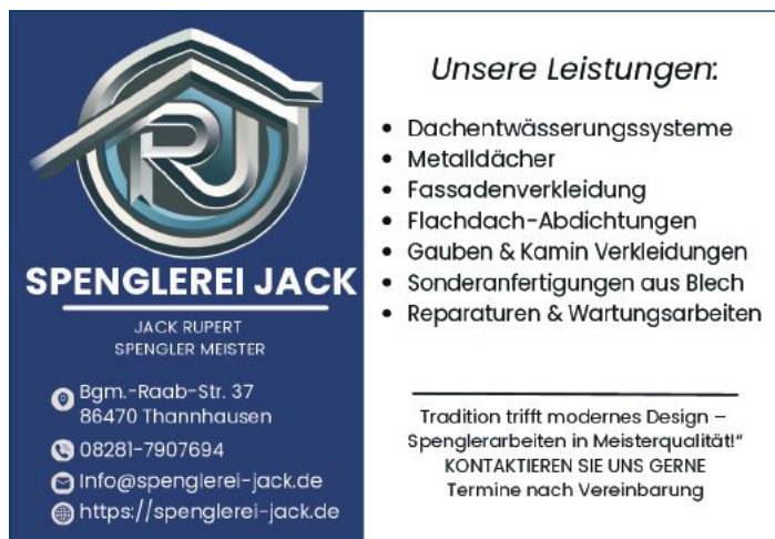
Text und Bild: Maria Wiedemann

„Gemeinsam kochen. Gemeinsam essen. Köstlich“, sagte eine begeisterte Studierende. Für die Ausbildung zur Fachkraft am AELF für 2026/2028 gibt es im Amt für Ernährung, Landwirtschaft und Forsten in Krumbach einen Schnupperabend am 20. Mai um 18 Uhr. Anmeldung wird erbeten unter: www.aelf-km.bayern.de