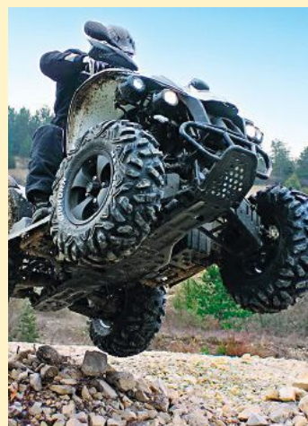
Quadfahren im Gelände macht tierischen Spaß!

Um 11 Uhr beginnt die Party mit „Stevy Rox unplugged“ und