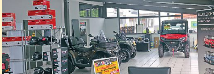
Nach der Renovierung: Ausstellungsräume im neuen Glanz