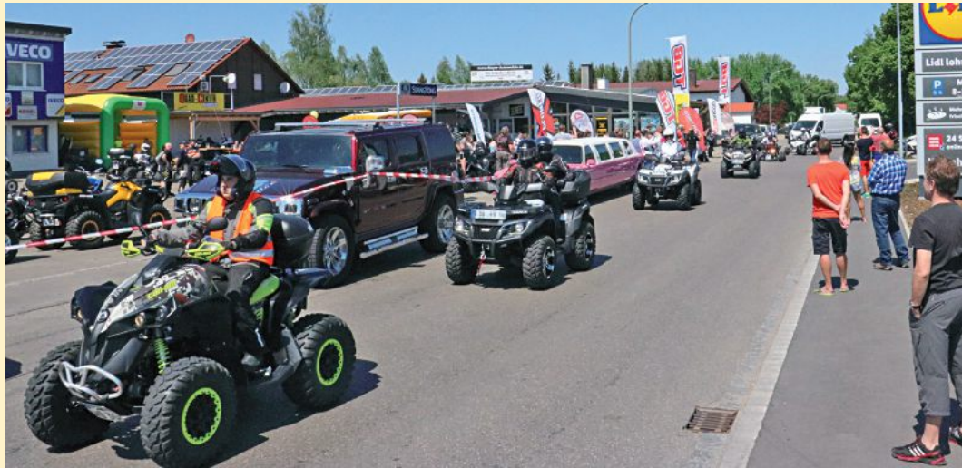
Zur diesjährigen Rundfahrt werden wieder zahlreiche Quads am Start sein.

Thannhausen. Zur neunten Frühjahrs-Party samt großer Quad-Rundfahrt lädt am Sonntag, den 17. Mai, von 10 bis 17 Uhr das Quad-Center Mindeltal an der Bürgermeister-Raab-Straße 35 im Autohaus Mayer (das es bereits seit 26 Jahren gibt).