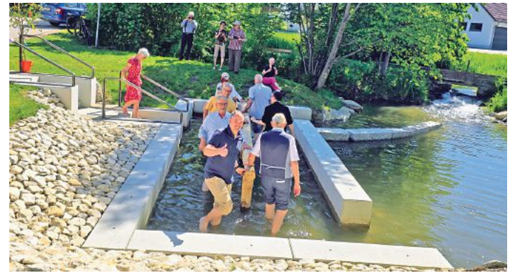
Daumen hoch vom 1. Bürgermeister Tobias Mayr für die neue Kneippanlage in Balzhäusen.

Balzhäusen. Bei strahlendem Sonnenschein ist am vergangenen Wochenende die neue Kneippanlage in Balzhäusen feierlich eingeweiht worden. Zahlreiche Bürgerinnen und Bürger waren der Einladung des Dorftreffs gefolgt und erlebten eine rundum gelungene Eröffnung, die einmal mehr zeigte, was gemeinschaftliches Engagement in einem Dorf bewegen kann.