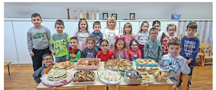
Kindertagesstätte St. Vinzenz

Thannhausen. In der Kindertagesstätte St. Vinzenz in Thannhausen haben die Kinder vom Sprachclub ihre verschiedenen Herkunftsländer genauer unter die Lupe genommen. Zuhause wurden von den Eltern und Kindern bunte Plakate mit allerlei Informationen zu den jeweiligen Ländern gestaltet. Dabei lernten die Kinder beispielsweise, dass in Ungarn das Rackaschaf be-