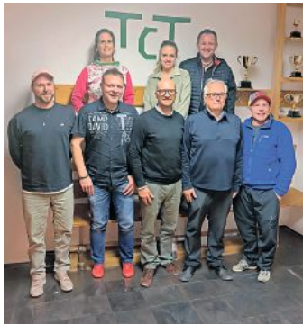
Der neu gewählte Vorstand des TC Thannhausen