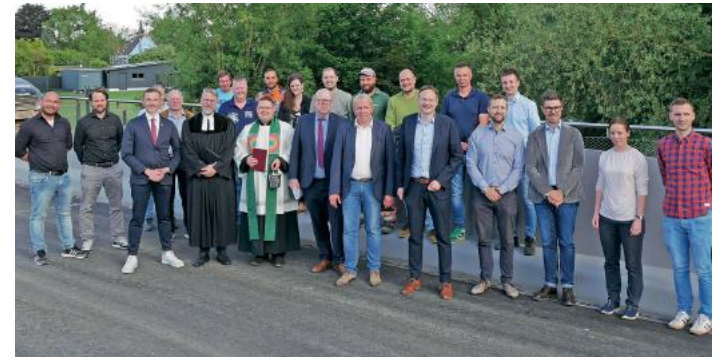
Der Ersatzneubau der Mindelbrücke in Jettingen-Scheppach ist abgeschlossen.

Jettingen-Scheppach. Die neue Mindelbrücke im Zuge der Wetenhauser Straße in Jettingen-Scheppach ist fertiggestellt und wurde am Freitag, 29. Mai, offiziell für den Verkehr freigegeben. Im Rahmen der offiziellen Freigabe erhielt die Brücke auch den kirchlichen Segen.