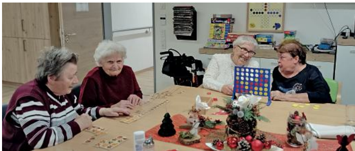
Die Tagespflege bietet kurzweilige Unterhaltung für die Gäste

gleichzeitig werden qualifizierte Pflegefachkräfte knapper. Der Pflegedienst Riederle wächst deshalb bewusst kontrolliert. Neue Klientinnen und Klienten werden nur aufgenommen, wenn die hohe Qualität der Versorgung dauerhaft sichergestellt werden kann. Aktuell bestehen noch vereinzelt freie Kapazitäten in der ambulanten Pflege sowie in der Tagespflege. Eine frühzeitige Beratung lohnt sich daher.