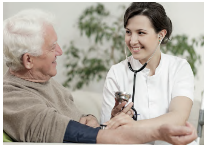
Der ambulante Pflegedienst versorgt mit Dienstleistungen zuhause

Wir bilden aus: • Pflegefachkräfte • Pflegefachhelfer