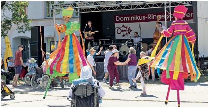
Auch die Farbtänzer des Zebra-Stelzentheaters München sind wieder zu Gast.