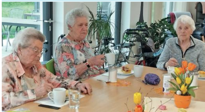
Helle, großzügige Räume machen den Aufenthalt angenehm.

Kostenloser Schnuppertag nach Vereinbarung möglich